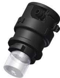
Hochrenk Stopfen III G51000