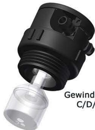
Gewinde Stopfen III C/D/E/F51000

Die von bfs zur Verfügung gestellten Zeichnungen zur Verschlauchung von Batterie Füllungs Systemen sind lediglich Beispiele, die in jedem einzelnen Fall den gegebenen Bedingungen und der Anordnung der zu verschlauchenden Batterien angepasst werden müssen. Wer die Verschlauchung vornimmt oder vornehmen lässt, ist dafür verantwortlich, dass die Vorschriften des jeweiligen Batterie Herstellers sowie die einschlägigen Vorschriften der Europäischen Union beachtet werden. z.B. EU-Norm EN 50272-3, Pkt. 10.2.2.