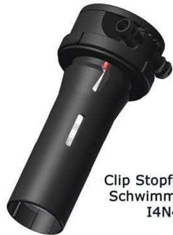
Clip Stopfen III mit Schwimmerschutz 14N420