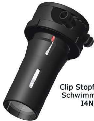
Clip Stopfen IV mit Schwimmerschutz I4N260

Die von bfs zur Verfügung gestellten Zeichnungen zur Verschlauchung von Batterie Füllungs Systemen sind lediglich Beispiele, die in jedem einzelnen Fall den gegebenen Bedingungen und der Anordnung der zu verschlauchenden Batterien angepasst werden müssen. Wer die Verschlauchung vornimmt oder vornehmen lässt, ist dafür verantwortlich, dass die Vorschriften des jeweiligen Batterie Herstellers sowie die einschlägigen Vorschriften der Europäischen Union beachtet werden. z.B. EU-Norm EN 50272-3, Pkt. 10.2.2.