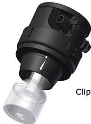
Clip Stopfen III 151000

Die von bfs zur Verfügung gestellten Zeichnungen zur Verschlauchung von Batterie Füllungs Systemen sind lediglich Beispiele, die in jedem einzelnen Fall den gegebenen Bedingungen und der Anordnung der zu verschlauchenden Batterien angepasst werden müssen. Wer die Verschlauchung vornimmt oder vornehmen lässt, ist dafür verantwortlich, dass die Vorschriften des jeweiligen Batterie Herstellers sowie die einschlägigen Vorschriften der Europäischen Union beachtet werden. z.B. EU-Norm EN 50272-3, Pkt. 10.2.2.