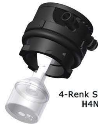
4-Renk Stopfen IV H4N000

Die von bfs zur Verfügung gestellten Zeichnungen zur Verschlauchung von Batterie Füllungs Systemen sind lediglich Beispiele, die in jedem einzelnen Fall den gegebenen Bedingungen und der Anordnung der zu verschlauchenden Batterien angepasst werden müssen. Wer die Verschlauchung vornimmt oder vornehmen lässt, ist dafür verantwortlich, dass die Vorschriften des jeweiligen Batterie Herstellers sowie die einschlägigen Vorschriften der Europäischen Union beachtet werden. z.B. EU-Norm EN 50272-3, Pkt. 10.2.2.