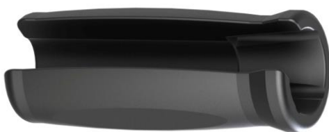
part no. 09MOD1

To ease and quicken the assembly of the bfs twist clamps bfs has added a special assembly tool to its product range. The tools are available for twist clamps 08KLE1 b (hoses 10mm) and twist clamps 08KLE6 b (hoses 6mm).