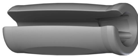
part no. 09MOD6